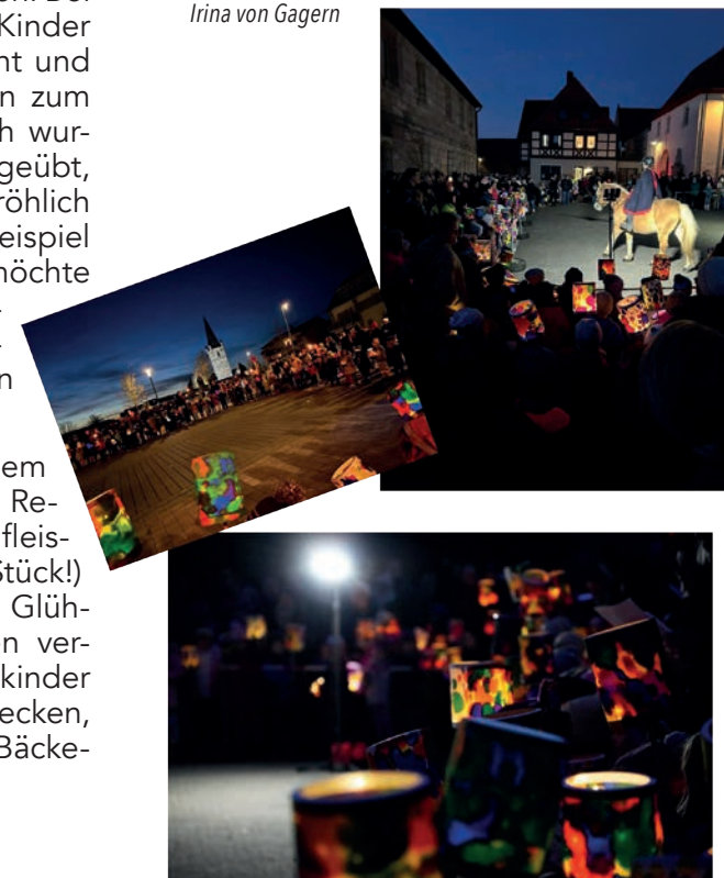
Irina von Gagern

Als nächstes plant der Kindergarten wieder einen Adventskalender, der entlang des Bauzaunes aufgehängt werden wird. Wer sich dort in Weihnachtsstimmung bringen lassen möchte, ist herzlich eingeladen.