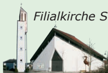
Filialkirche St. Michael