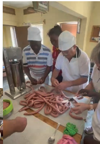
Fränkische Bratwürste in Busagula

Spendenkonto Ugandahilfe: Katholische Kirchenstiftung Hannberg IBAN: DE30 7606 9602 0300 0116 65 BIC: GENODEF1HSE BANK: Raiffeisenbank Dreifranken