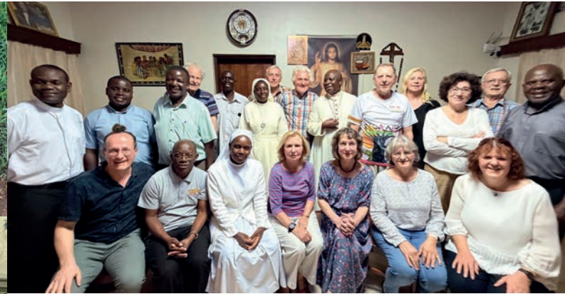
Nach der Einladung mit Abendessen bei Bischof Jjumba

In Zukunft wird es weiterhin fairen Kaffee aus unserer