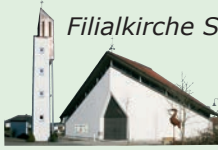
Filialkirche St. Michael